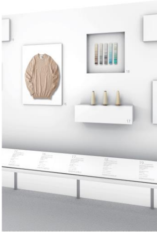
コーナーイメージ